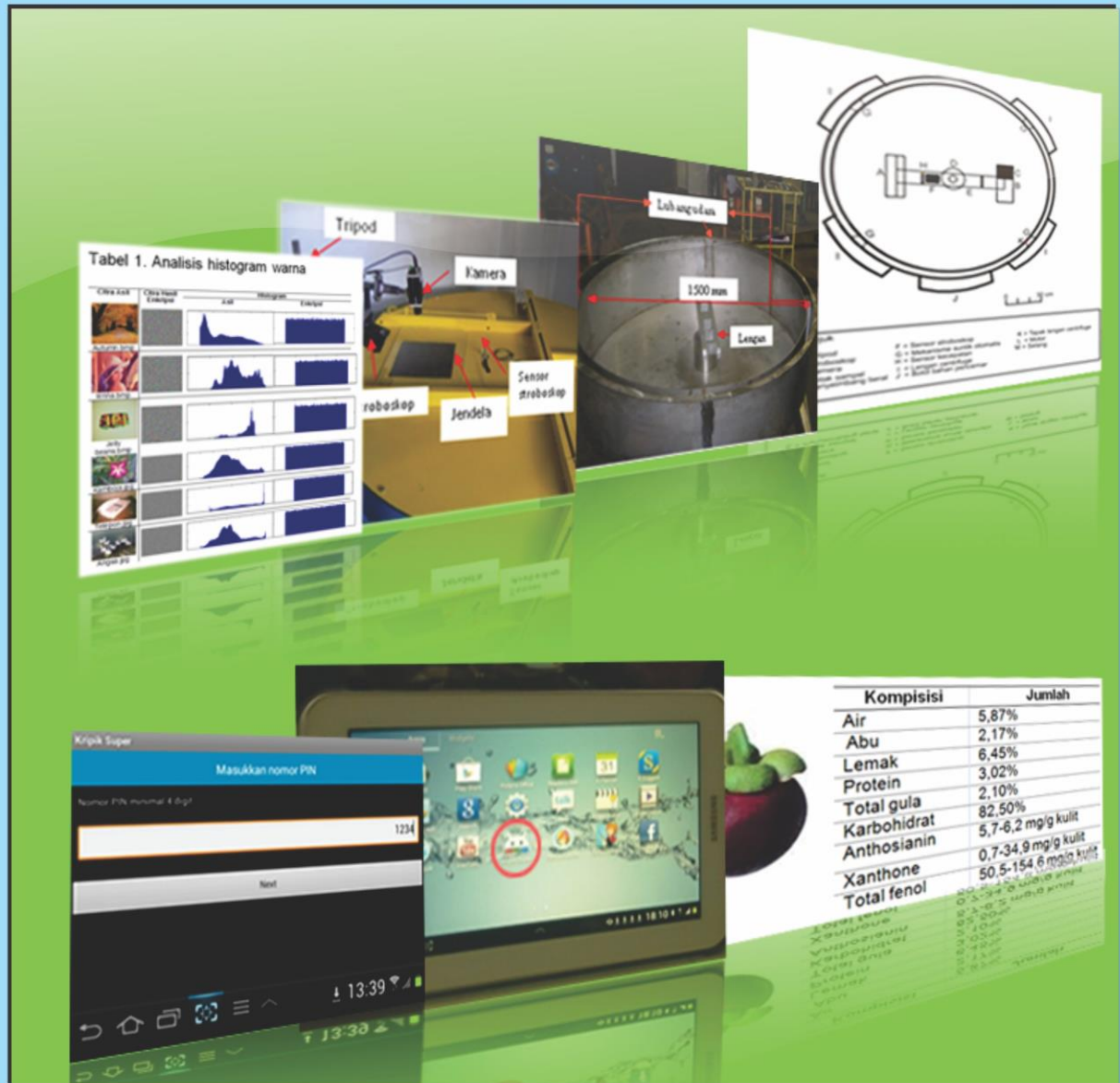
Tabel 1. Analisis histogram warna