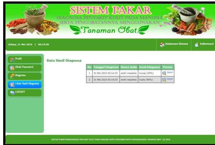
Gambar 8. Tampilan Halaman Lihat Hasil Diagnosa

Halaman lihat hasil diagnosa merupakan halaman yang menampilkan seluruh daftar pencatatan diagnosa yang pernah dilakukan oleh pasien, lengkap dengan tanggal dan waktu diagnosa beserta rincian diagnosa (detail). Adapun tampilan halaman lihat hasil diagnosa dapat dilihat pada gambar 8