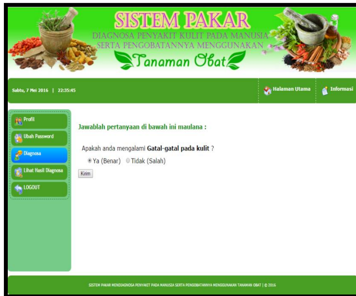
Gambar 6. Tampilan Halaman Diagnosa

suatu gejala. Dari proses diagnosa akan didapatkannya hasil diagnosa penyakit serta pengobatan dengan tanaman obat. Adapun tampilan halaman diagnosa dapat dilihat pada gambar 6