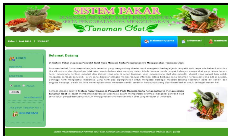
Gambar 3. Tampilan Halaman Utama

Halaman ini merupakan halaman awal yang dapat diakses pengguna dari aplikasi sistem pakar untuk diagnosa penyakit kulit pada manusia serta pengobatannya menggunakan tanaman obat. Pada halaman utama sistem terdapat beberapa menu antara lain menu informasi, menu bantuan, menu login user, menu registrasi pasien, dan menu lupa password. Adapun tampilan halaman utama sistem dapat dilihat pada gambar 3