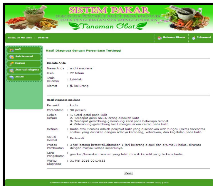
Gambar 7. Tampilan Halaman Hasil Diagnosa

Halaman hasil diagnosa merupakan tampilan dari hasil diagnosa pasien. Pasien yang telah menjawab pertanyaan pada sistem konsultasi akan mendapatkan kesimpulan berupa nama penyakit beserta saran pengobatannya menggunakan tanaman obat. Halaman hasil diagnosa ini meliputi biodata pasien (nama pasien, usia, jenis kelamin dan alamat) serta hasil diagnosa penyakit dan pengobatannya menggunakan tanaman obat (nama penyakit, persentase, gejala umum, definisi, solusi herbal, proses pembuatan, cara pengobatan dan waktu diagnosa). Adapun tampilan halaman hasil diagnosa dapat dilihat pada gambar 7