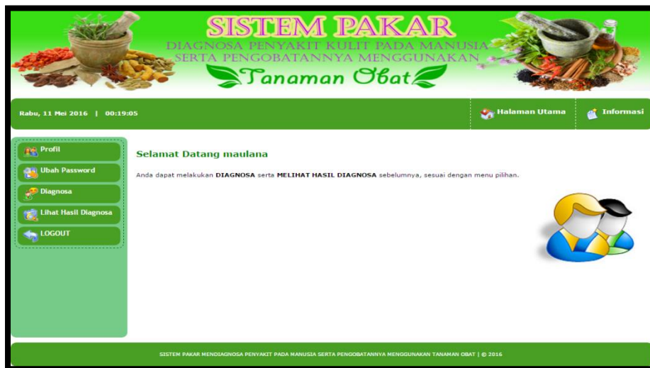
Gambar 5. Tampilan Halaman Utama Pasien

Halaman utama user merupakan halaman yang pertama kali tampil setelah pasien berhasil melakukan login. Halaman ini memiliki banyak menu yang dapat diakses oleh pasien khususnya dalam hal mendiagnosa penyakit. Adapun tampilan dari halaman utama pasien ditunjukkan pada gambar 5