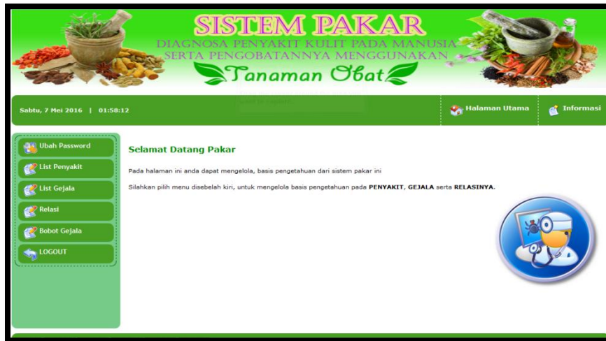
Gambar 4. Tampilan Halaman Utama Pakar

Halaman utama pakar merupakan halaman yang pertama kali tampil setelah pakar berhasil melakukan login. Halaman ini memiliki banyak menu yang dapat diakses oleh pakar, khususnya yang berkaitan dengan basis pengetahuan seperti pengolahan data penyakit, pengolahan data gejala, pengolahan data relasi penyakit dan gejala serta pengolahan data bobot gejala. Adapun tampilan halaman utama pakar dapat dilihat pada gambar 4