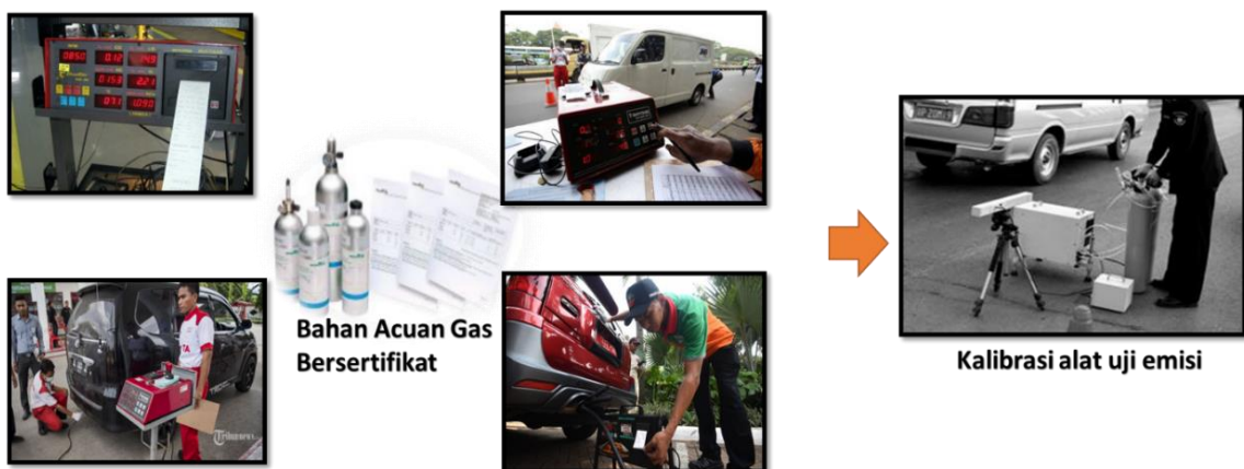
Gambar 2. Alat-alat Uji Emisi

Kaitannya dengan uji emisi gas buang kendaraan bermotor, jaminan mutu hasil pengukuran/ pengujian nya dapat dicapai apabila alat uji emisi dikalibrasi menggunakan bahan acuan gas bersertifikat (standar gas bersertifikat) atau biasa dikenal dengan Certified Reference Materials , seperti yang ditanyakan dalam SNI 19-7118. Gambar 2 menunjukkan alat-alat uji emisi yang harus dikalibrasi menggunakan bahan acuan bersertifikat.