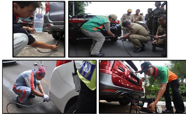
Gambar 1. Wajib uji emisi kendaraan bermotor di wilayah DKI Jakarta