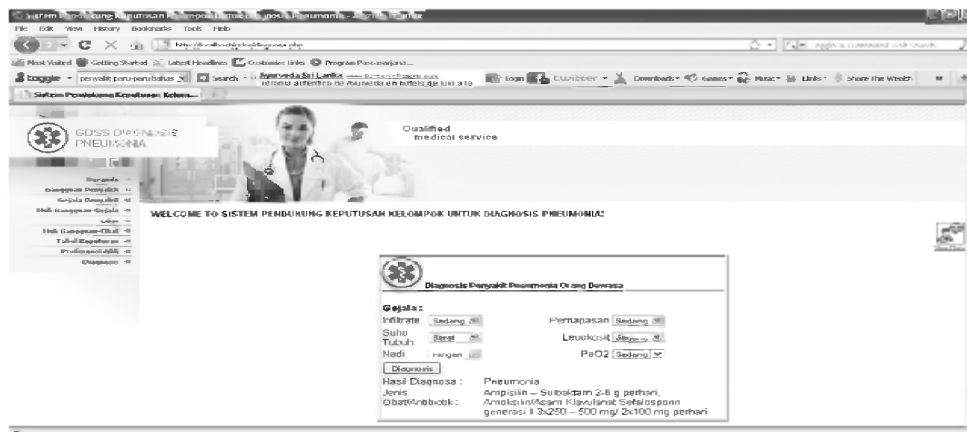
Gambar 2 Hasil Diagnosa