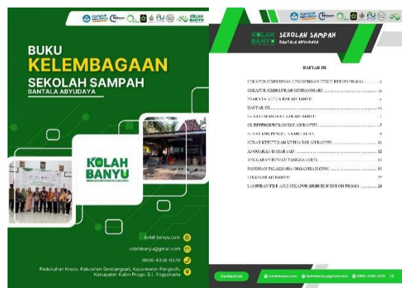
Gambar 6. Buku kelembagaan Kolah Banyu

Gambar 5. Penyerahan SK pembentukan sekolah sampah dan pelantikan pengurus Kolah Banyu. Selanjutnya Tim PPK Ormawa BEM Akprind University bersama pengurus Kolah Banyu menyusun dokumen Buku Kelembagaan yang berisi sambutan dari DLH Kulon Progo, Lurah Sendangsari, Ketua Kolah Banyu, SK Pembentukan Kolah Banyu, SK Kepengurusan Kolah Banyu, Surat izin penggunaan lahan, AD/ART seperti diperlihatkan pada Gambar 6