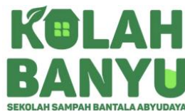
Gambar 3. Logo Kolah Banyu