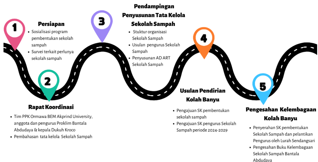
Gambar 1. Alur Tahapan Kegiatan

Pengabdian kepada Masyarakat (PkM) Tematik Pemberdayaan Desa yang dilakukan oleh tim PPK Ormawa BEM Akprind University adalah membangun Sekolah Sampah yang diinisiasi bersama Proklam Bantala Abyudaya Kalurahan Sendangsari Pengasih Kulon Progo. Program PkM yang dilaksanakan berupa pendampingan dan penyusunan dokumen kelembagaan bagi Sekolah Sampah. Sasaran dari kegiatan PKM ini adalah Proklam Bantala Abyudaya, BSI Dhuawar Sejahtera beserta 31 BSU dibawahnya, tokoh masyarakat sekitar, dan dinas – dinas terkait. Metode yang dilakukan terdiri atas lima tahapan, yaitu 1) Persiapan; 2) Rapat Koordinasi; 3) Pendampingan, 4) Usulan Pendirian, 5) Sekolah Sampah Bantala Abyudaya Resmi Berdiri seperti diperlihatkan pada Gambar 1.