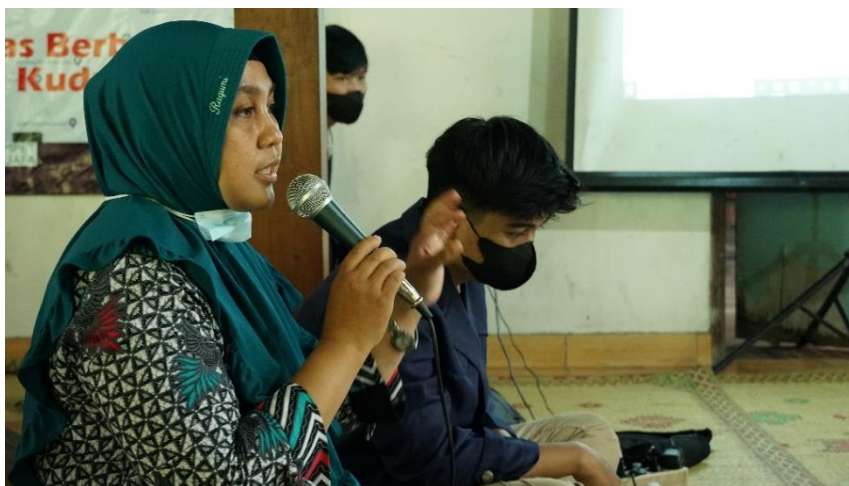
Gambar 2. Sesi Pemateri memberikan penjelasan awal tentang Forum Diskusi Web