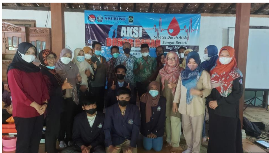
Gambar 5. Foto bersama peserta dan pemateri di akhir sesi