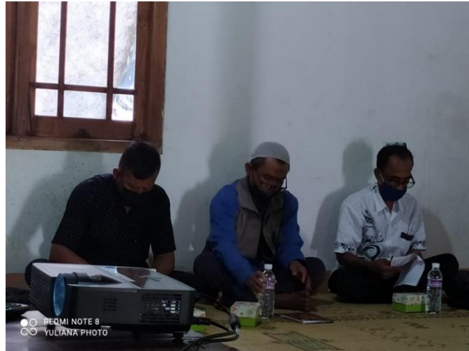
Gambar 3. Sesi peserta mendengarkan pemaparan narasumber.