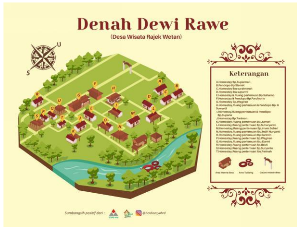
Gambar 1: Peta Desa Wisata Rajek Wetan