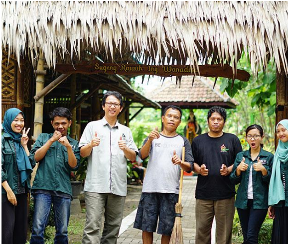
Gambar 7: Survei di Wana Desa Dewi Rawe