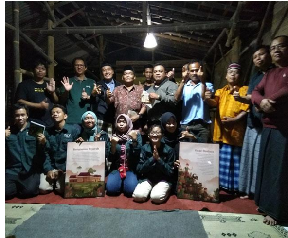
Gambar 8: Sarasehan penutup program Abdimas