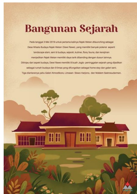
Gambar 6: Poster Promosi Dewi Rawe