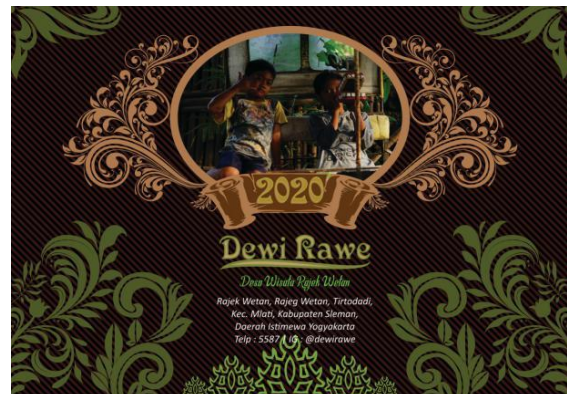
Gambar 4: Kalender 2020 Dewi Rawe