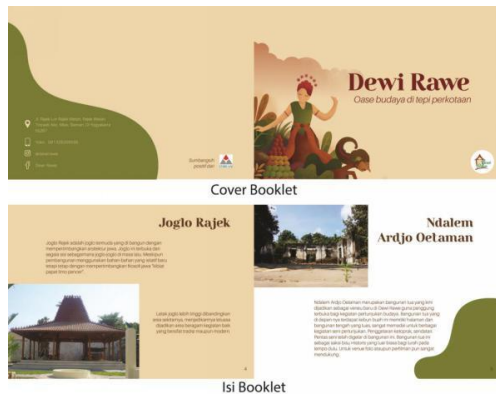
Gambar 3: Booklet Dewi Rawe