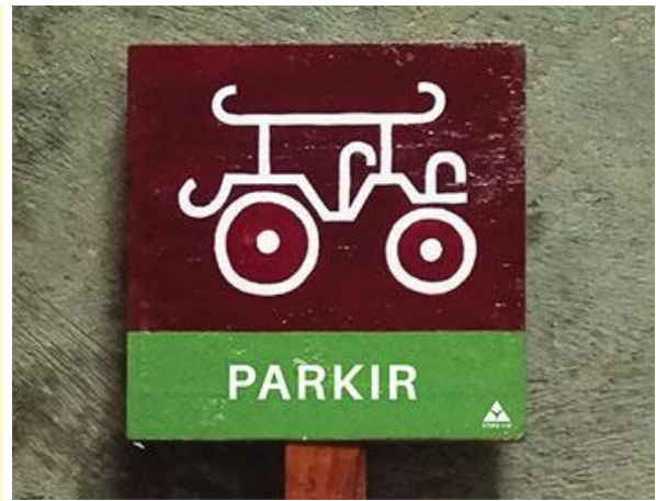
Gambar 2: Sign System Dewi Rawe